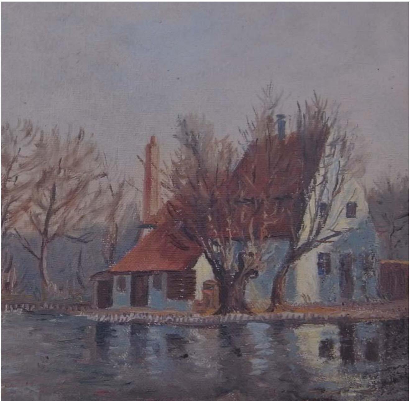
Skipperhuset - Malet af billedskærer A. Andersson omkr. 1930 (privateje).

Medlemsblad for FREDENSBORG-HUMLEBÆK LOKALHISTORISKE FORENING 2. årgang nr. 2 – Efterår 2015